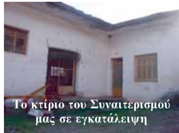
Το κτίριο του Συναιτερισμού μας σε εγκατάλειψη