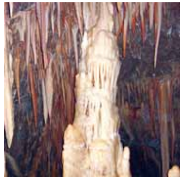
αδικία, που συντελείται σε βάρος του Χωριού μας.

Να γνωρίζετε ότι ΔΕΝ ΘΑ ΜΕΙΝΟΥΜΕ ΧΩΡΙΣ ΝΕΡΟ το καλοκαίρι, όταν το πόσιμο νερό ρέει εν αφθονία στα άλλα Δημοτικά