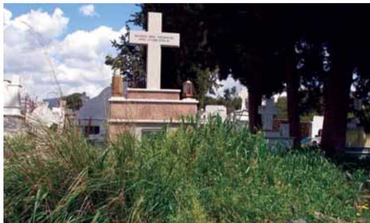
Το κοιμητήριο των Αγίων Αποστόλων σε πραγματική κατάντια.

Η μήπως ενοχλήστε γιατί δεν τηρούμε τα πρωτόκολλα εθμοτυπίας και αυθαιρετούμε!