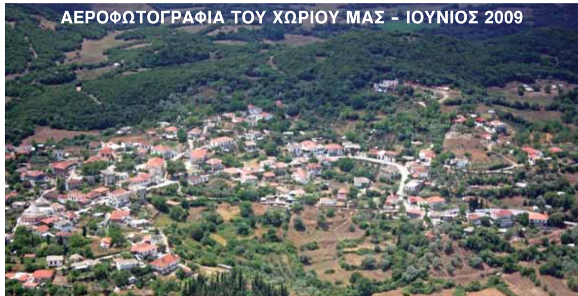
ΑΕΡΟΦΩΤΟΓΡΑΦΙΑ ΤΟΥ ΧΩΡΙΟΥ ΜΑΣ - ΙΟΥΝΙΟΣ 2009

Κεφ 7 "Ο βασιλεύς, διέβη τον Αχελώο ποταμόν και εβάδισε ταχέως κατά του Θέρμου, κατά δε την προέλασή του εληηλάτει και κατέστρεψε τη χώρα."