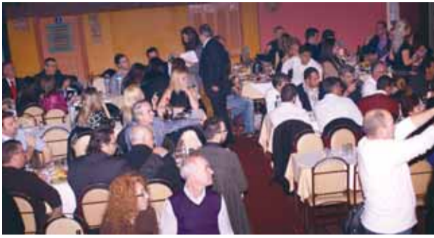
ΣΥΝΕΧΕΙΑ από 1η σελίδα

Υπήρξαν στιγμές που το κέφι απογειώθηκε και η πίστα του κέντρου ασφυκτιούσε από τον κόσμο, « δίνοντας τα τραπέζια την λύση» σε επιδέξιους χορευτές, να επιδείξουν τις χορευτικές τους ικανότητες, χορεύοντας ασταμάτητα και σε διάφορους ρυθμούς μέχρι το πρωί.