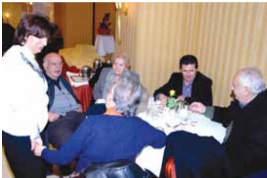
Από τη φετεινή Γενική μας Συνέλευση