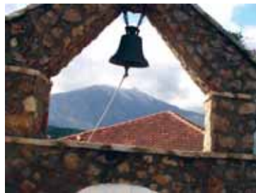
Η ομορφιά της καμπάνας

Εκτιμώντας ότι, προσεγγίζετε με αντικειμενικότητα την πιθανή ιστορική προέλευση του ονόματος του χωριού μας και δεδομένου της επάρκειας γνώσεων που ασφαλώς διαθέτετε, είστε ιδιαίτερα χρήσιμος ώστε να αποσαφηνίσουμε τη διγνομία των ιστορικών αναφορικά με την Αρχαία Κωνώπη ή Κωνόπα την οποία ο Στράβωνας την καταγράφει ως πόλη Αιτωλική, η οποία το 287-280 π.χ μετανομάσθηκε σε Αρσινόη, προς τιμή της αδελφής και συζύγου του Πτολεμαίου Β'. του Φιλάδεφου