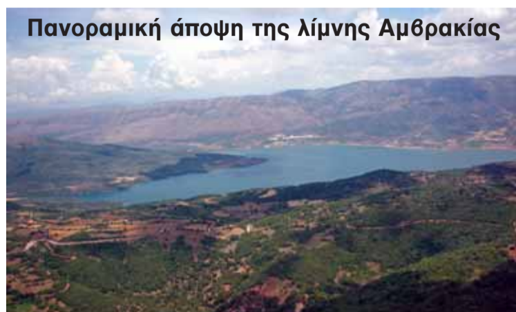
Πανοραμική άποψη της λίμνης Αμβρακίας

Στα πλαίσια του κανονισμού αυτού έχει αναληφθεί η υποχρέωση υλοποίησης